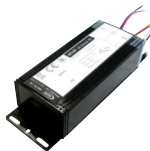
ADSLG (SPST 1FORM A)