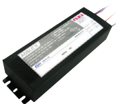
ADSLC II (DPST 2FORM Y)